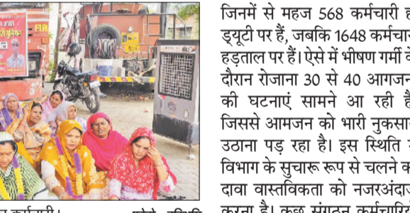
गुहला-चीका। भूख हड़ताल पर बैठे दमकल कर्मचारी।