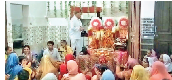
उचाना। भजन-कीर्तन में पहुंचे श्रद्धालु।

बताया कि इस तरह के जागरूकता अभियान का उद्देश्य लोगों में सतर्कता बढ़ाना है ताकि समय रहते मच्छरजनित बीमारियों पर नियंत्रण पाया जा सके। उन्होंने बच्चों से अपील की कि वे घर जाकर अपने परिवार के सदस्यों को भी इन बातों की जानकारी दें और साफ-सफाई बनाए रखने में सहयोग करें। अभियान के दौरान अध्यापकों, स्वास्थ्य कर्मी एवं आशा वर्कर उपस्थित रहे और सभी ने मिल कर मच्छरजनित बीमारियों के खिलाफ जागरूकता फैलाने का संकल्प लिया।