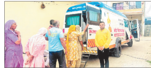
गुहला चीका। घर-द्वार पर मुफ्त जांच और दवाइयों का लाभ उठाते लोग।

लोगों को उनके घर के पास ही स्वास्थ्य सेवाएं उपलब्ध कराने के उद्देश्य से सांसद नवीन जिंदल फाउंडेशन की मेडिकल वैन मंगलवार को सीवन पहुंची। इस दौरान मेडिकल टीम ने 107 लोगों के स्वास्थ्य की जांच कर उन्हें निशुल्क दवाइयों वितरित कीं, जबकि 14 लोगों के मुफ्त लैब टेस्ट भी किए गए। कार्यक्रम के दौरान डॉ. बलिन सिंह के नेतृत्व में टीम ने मरीजों की जांच की और उन्हें आवश्यक परामर्श दिया। डॉ. बलिन सिंह ने बताया कि सांसद नवीन जिंदल का उद्देश्य है कि आमजन को मंहगी