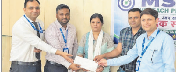
राजौंद। आयोजित कार्यक्रम के दौरान मौजूद बैंक अधिकारी एवं स्टाफ सदस्य।

राजौंद। राजौंद के सरकारी अस्पताल के सामने पत्थर लगने से पर गंभीर चोट आई, जिसके बाद घायल युवक, चेहरे पर आई चोट दिखाते हुए। कहेना है कि इस मार्ग पर इस तरह की घटनाएं अक्सर होती रहती हैं। सड़क पर निर्माण कार्य अधूरा होने के कारण छोटे-बड़े पत्थर इधर-उधर बिखरे रहते हैं और वाहनों के गुजरने से ये पत्थर तेजी से उड़कर राहगीरों को चोट पहुंचाते हैं। लोगों में इस घटना को लेकर भारी रोष है। उन्होंने प्रशासन से संबंधित विभाग व ठेकेदार के दिखड़ कार्यवाही करने कि मांग की है और शीघ्र सड़क निर्माण कार्य को पूरा किया जाए, ताकि आमजन को राहत मिल सके।