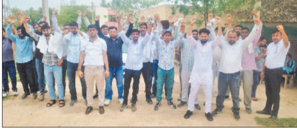
विद्युत प्रसारण निगम कार्यालय के गेट पर मीटिंग कर रोष प्रदर्शन करते कर्मचारी।