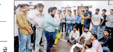
जींद। विश्वविद्यालय परिसर में वीसी के ओएसडी को मांगों से अवगत करवाते हुए छात्र।