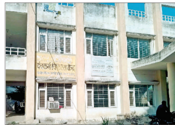
जींद। सेक्टर आठ स्थित पालीक्लीनिक।

आ जाएंगे और यहां पंचकर्म केंद्र चलाएंगे। स्वास्थ्य विभाग अपने सेक्टर 8 स्थित पालीक्लीनिक में कैथ लैब स्थापित करना चाहता है। जब यहां पर कमरों की व्यवस्था देखी तो लगभग दस कमरों में आयुष विभाग के पंचकर्म केंद्र का काम चल रहा था। स्वास्थ्य विभाग ने पंचकर्म केंद्र को नागरिक अस्पताल में चल रही आयुष की ओपीडी में शिफ्ट करने को पत्र लिखा। इसके बाद ही मामला बढ़ता चला गया। एक अप्रैल को सिविल सर्जन ने पंचकर्म केंद्र में एनएचएम के तहत कार्यक्रम एक चिकित्सक व सात कर्मचारियों की इयूटी नागरिक अस्पताल में लगा दी। इससे पंचकर्म का काम बंद हो गया। जांच के लिए