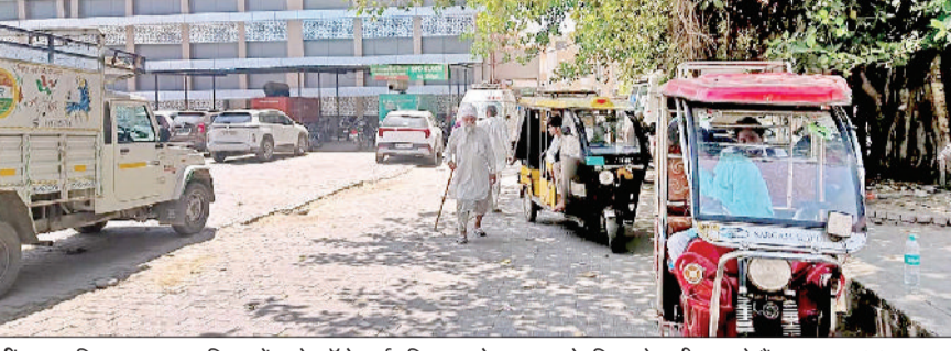
जींद। नागरिक अस्पताल परिसर में खड़े ऑटो व ई-रिक्शा, जो आमजन के लिए परेशानी बन रहे हैं।

जिला मुख्यालय स्थित नागरिक अस्पताल का परिसर इन दिनों श्रीव्हीलरों (ऑटो और ई रिक्शा) की अवैध पार्किंग में तबदील हो गया है। पूरा दिन नई बिल्डिंग के मुख्य गेट से लेकर अस्पताल परिसर के अंदरतक ऑटो और ई रिक्शा खड़े रहते हैं और सवारियों को ढोने का काम करते हैं। जिससे एम्बुलेंस और गंभीर मरीजों को ले जाने वाले वाहनों की आवाजाही बुरी तरह प्रभावित होती है। अस्पताल प्रशासन ने इसे गंभीर सुरक्षा समस्या बताते हुए अब पुलिस की मदद से इन श्रीव्हीलरों को हटाने का फैसला लिया है। प्रतिदिन सैकड़ों मरीज आते हैं उपचार के लिए नागरिक अस्पताल में रोजाना सैकड़ों मरीज उपचार के लिए पहुंचते हैं। अर्पिता बीमारियों, दुर्घटनाओं और प्रसव के मामलों में एम्बुलेंस और