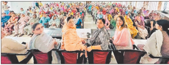
कैथल। बैठक में बातचीत करती भाजपा महिला मोर्चा की पदाधिकारी तथा सदस्य।