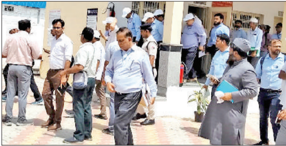
जींद। हाइड्रोजन प्लांट का निरीक्षण करते अधिकारी।

हुई। जैसे ही ट्रेन जंक्शन पर पहुंची तो ट्रेन को देखने के लिए यात्री उत्सुक नजर आए। ट्रेन के पास यात्रियों की भीड़ को देखते हुए रेलवे कर्मियों ने स्पेलश अनाउंसमेंट करवाई कि वे रोहतक जाने के लिए हाइड्रोजन ट्रेन नहीं चढ़ें। उनके लिए दूसरी ट्रेन इसी प्लेटफॉर्म पर थोड़ी देर में आएगी। यात्रियों ने ट्रेन के अंदर झांक कर देखा। इस यात्री ने ट्रेन के अंदर देखा कर बोला कि इसमें सिर्फ पानी के केन रखे हैं। वहीं यात्रियों ने ट्रेन के साथ सेल्फी भी ली। हाइड्रोजन